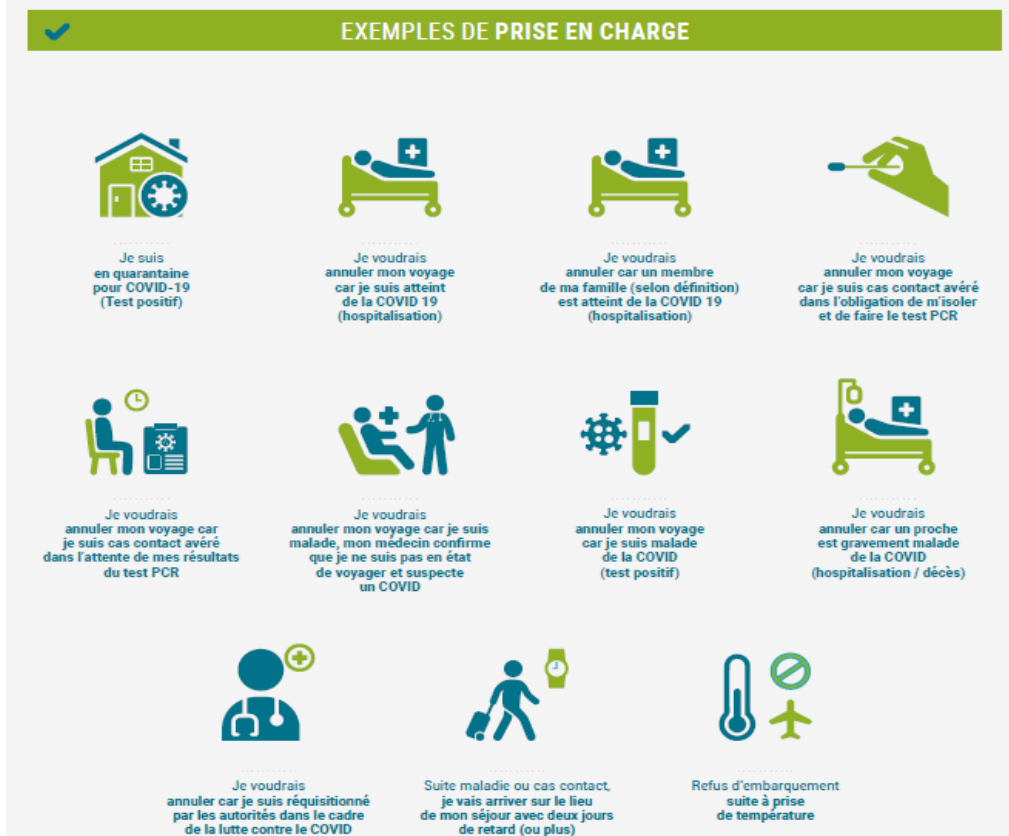
TABLEAU DES MONTANTS DE GARANTIES – EXTENSION COVID

Ci-dessous tableau le résumé des garanties spéciales COVID 19